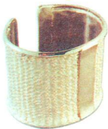
Manchette avec fil d'argent tissé 1700 F